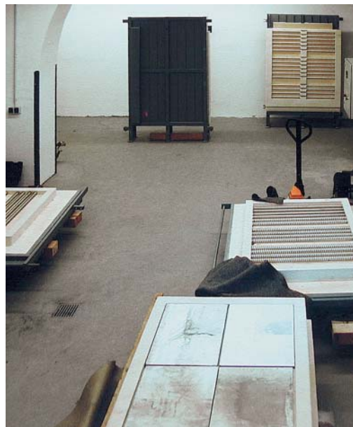
Alle Module vor Ort