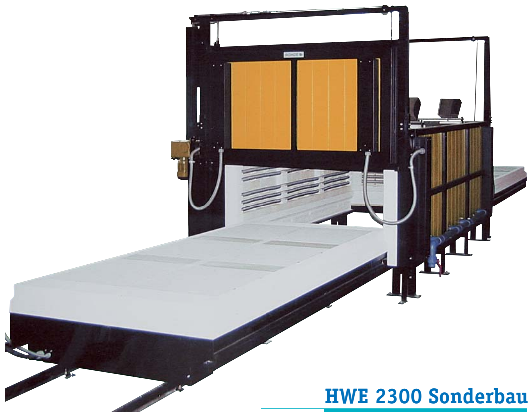
HWE 2300 Sonderbau

Die ROHDE Elektro-Herdwagenöfen sind für einen langjährigen Dauereinsatz im Werkstatt- und Industriebetrieb konzipiert. In puncto Technik und Sicherheit entsprechen sie dem neuesten Stand. Individuelle technische Ausstattungen sind jederzeit möglich.