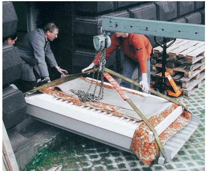
Durchs Souterrainfenster in den Keller